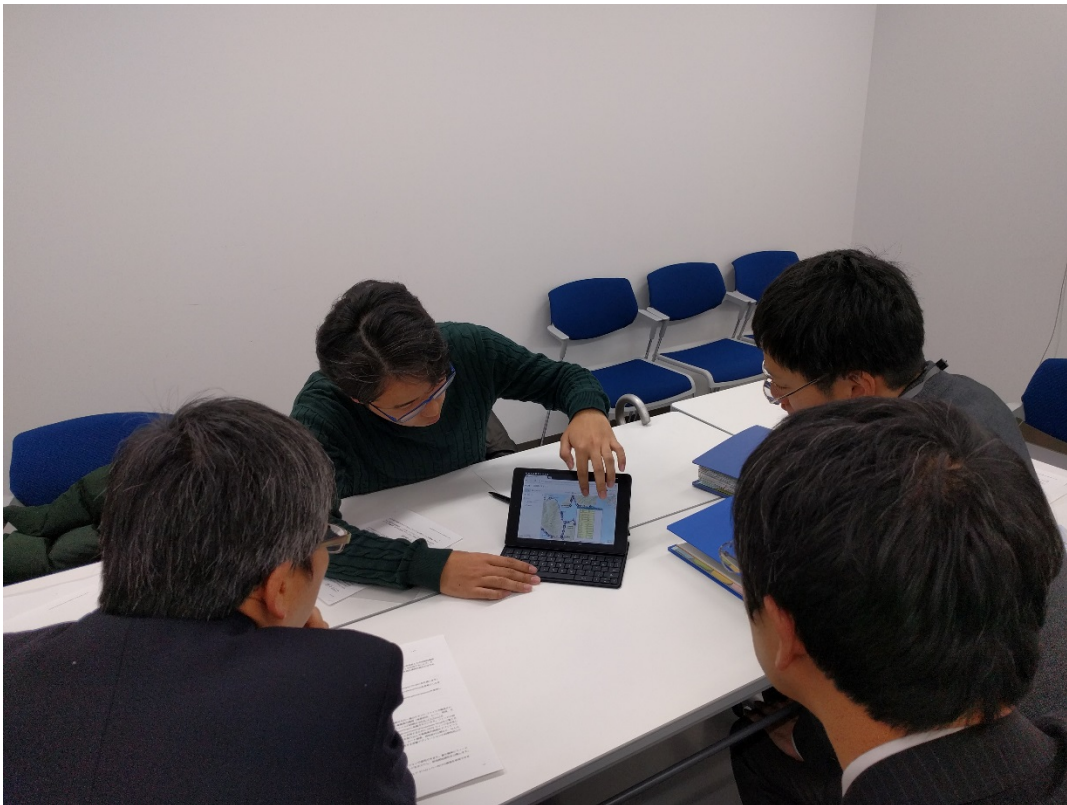
学生が江田島市役所で作成したデータを説明する様子

作業を始めた頃は、江田島市のことをよく知らなかったようであるが、自らの足で、現地の情報を収集し、それを分析することによって、現在では、江田島市内のバスについては、市外からの観光客にも案内ができるくらいに、知識を得ている。戦略協働プロジェクトは単年度の事業であるため、3 月末で終了するが、今後は GoogleMap 等で江田島市内の公共交通機関が検索できるように研究を続ける予定である。